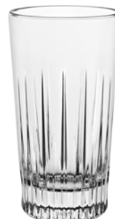
Cocktail Long Drink