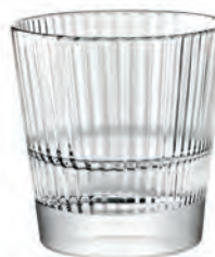
Diva 2.4.6. Dof