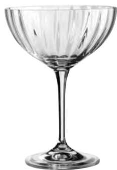
Vignoble 21 optic